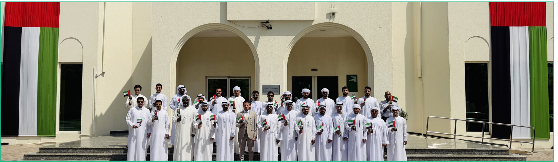
إدارة السكن تشارك في مبادرة تعزيز الهوية الوطنية وحب الوطن والقيادة فخورين بالإمارات.