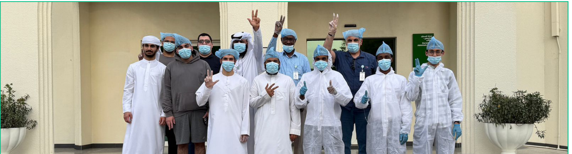
مشاركة طلاب السكن في مبادرة يوم الأرض ضمن حملة النظافة التطوعية.